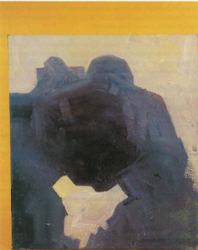
Beklaagde 80 x 90 cm.