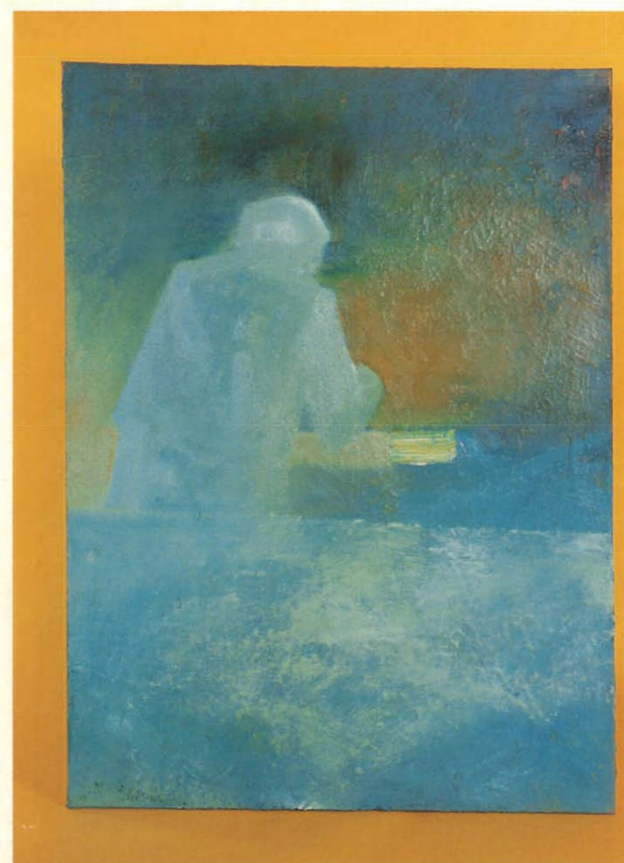
Orkest 70 x 95 cm.