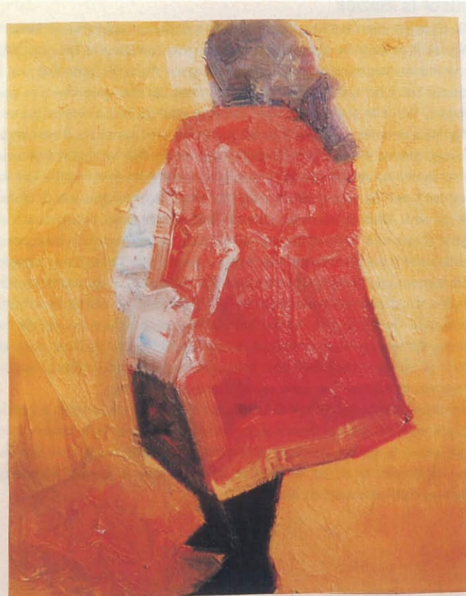
De Tenor 40 x 50 cm.

'Misschien is het schilderen een manier om dichterbij mezelf te komen, of om mezelf superieur te voelen'